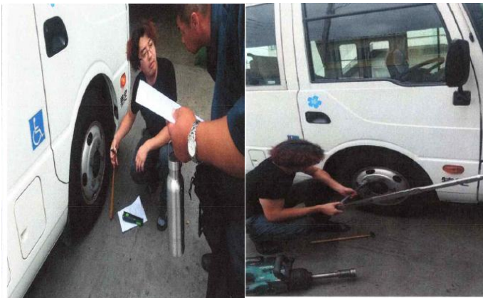
トルクレンチでクリップボルトの締め確認。