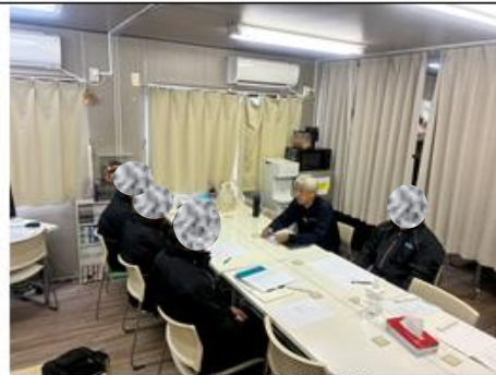
10:00～ ドライバーと情報交換